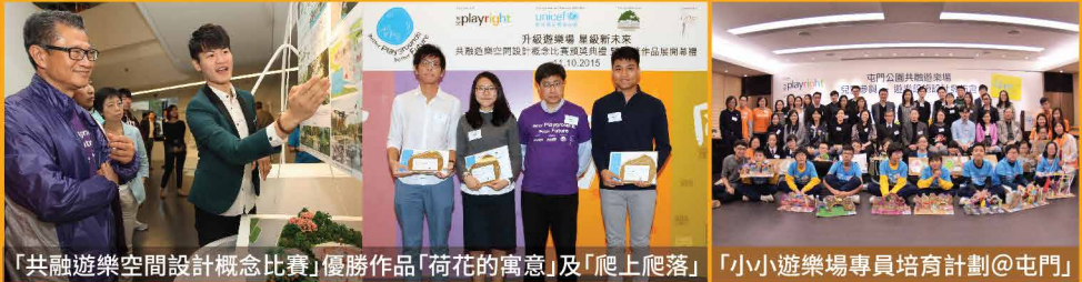
「共融遊樂空間設計概念比賽」優勝作品「荷花的寓意」及「爬上爬落」